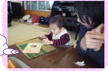
お絵かき たのしいな～

お母さんと一緒に好きな色の毛糸を選び、メッセージカードに紐通しをしました。その表情は真剣そのもの！